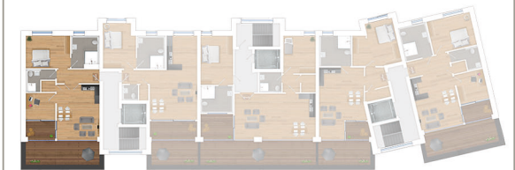
Lage im 3. Obergeschoss