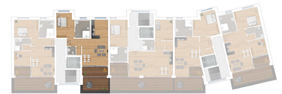
Lage im 3. Obergeschoss