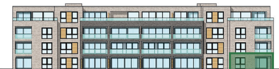
Lage im Haus (Südansicht)