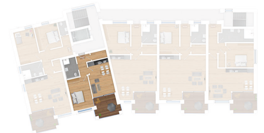
Lage im 2. Obergeschoss