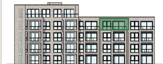
Lage im Haus (Westansicht)