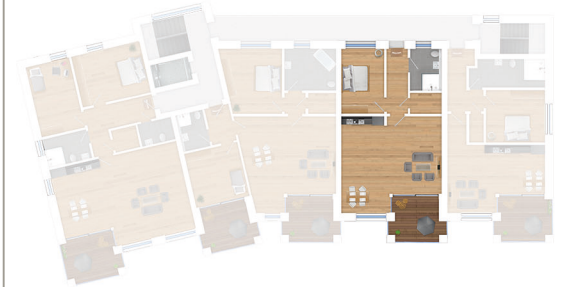
Lage im 3. Obergeschoss