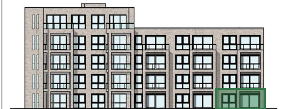
Lage im Haus (Westansicht)