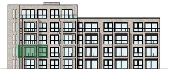
Lage im Haus (Westansicht)