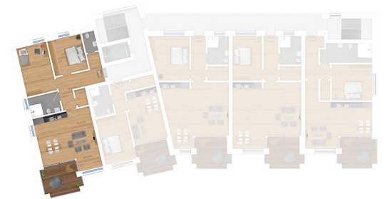
Lage im 1. Obergeschoss