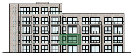
Lage im Haus (Westansicht)