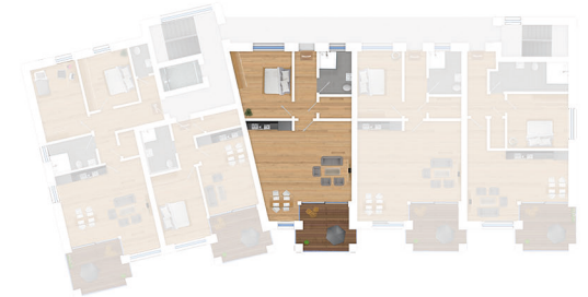
Lage im 1. Obergeschoss