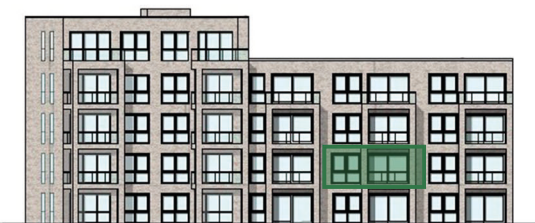
Lage im Haus (Westansicht)