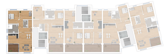
Lage im 1. Obergeschoss